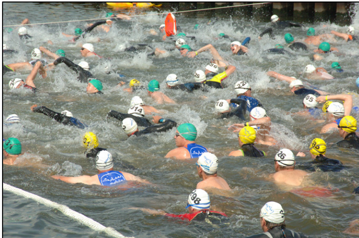
Triatlon Stein 2008