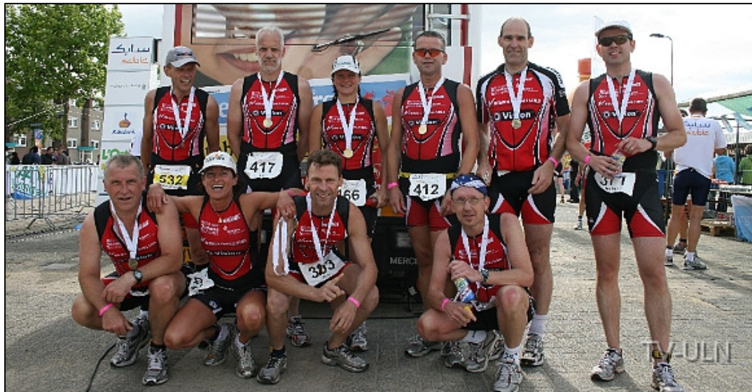
Een teamfoto na de triatlon in Stein in 2010.

De meeste triatleten van de groep van het eerste uur zijn inmiddels de 50 jaar gepasseerd. Afscheid nemen van de vereniging kunnen zij niet. Soms komen ze nog een keertje zwemmen, maar op de feestavond van de triatlongroep zijn meestal veel van hen present.