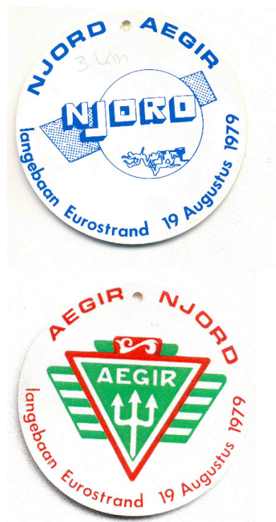
Het aandenken aan de 3 km wedstrijd

Halverwege de jaren '80 kwam de klad in het Lange Baan zwemmen en kwam deze tak van sport binnen de vereniging te vervallen.