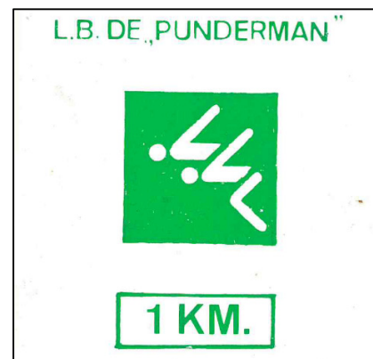
Een tegel in de clubkleuren van 1964 tot ongeveer 1992.

De afstanden waren 800 meter voor jongens en meisjes onder 12 jaar en 2000 meter voor dames en heren (wedstrijd- en recreatieve zwemmers).