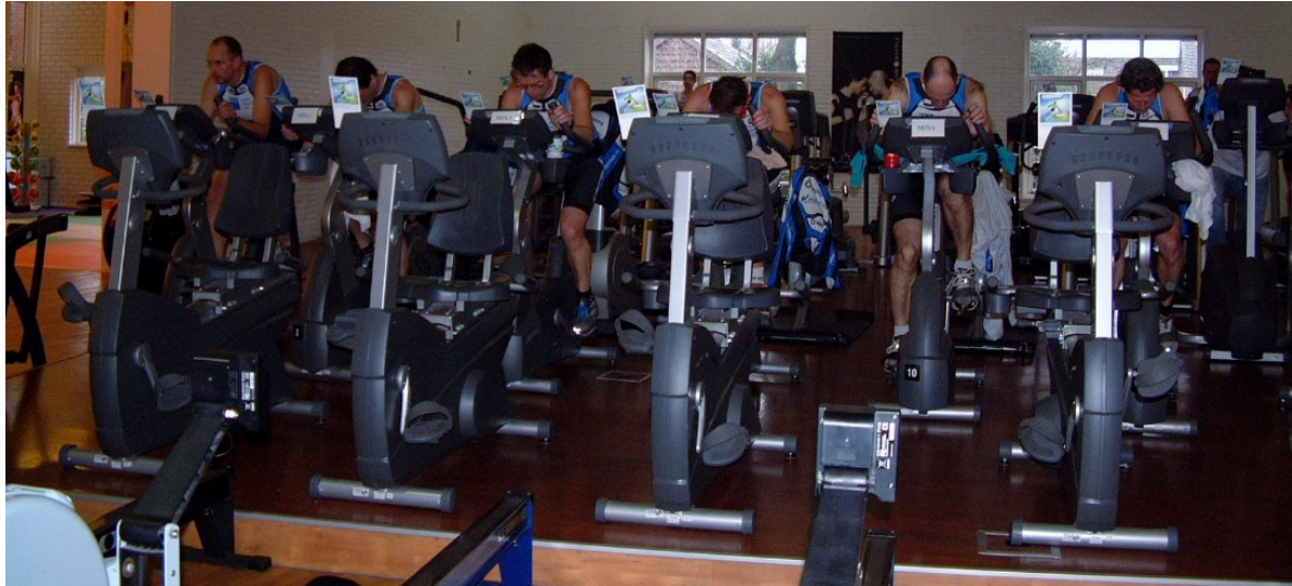
Indoor triatlon Nuenen 2014.

De indoor triatlon in Nuenen werd als pilot opgezet. De Punderman werd gevraagd om mee te doen en deze te evalueren. De opzet was goed en kleine verbeteringen werden doorgevoerd. Helaas is in 2014 de laatste versie hiervan geweest. Het blijft een hele klus: organiseren en genoeg vrijwilligers bij elkaar krijgen.