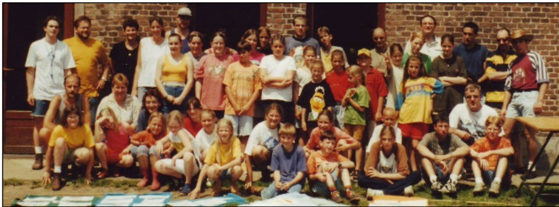
Kamp in 1998